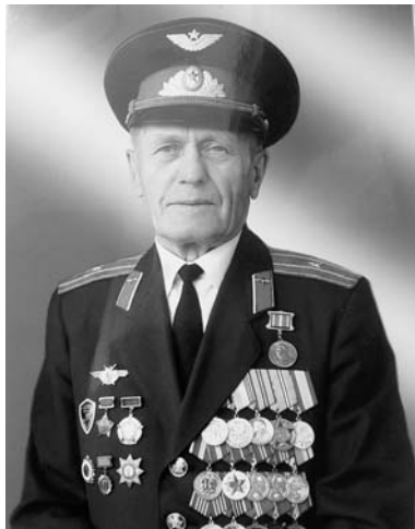
Вот что он написал в обращении к читателю: